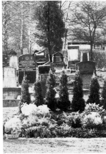
Left: Old Jewish cemetery in Kassel, showing various stylistic periods in its gravestones (neoclassical grave column).

A droite: Grebenstein: Le dernier emplacement tombal de ce cimetière rural a été aménagé en 1980; il est entretenu selon des pratiques chrétiennes.