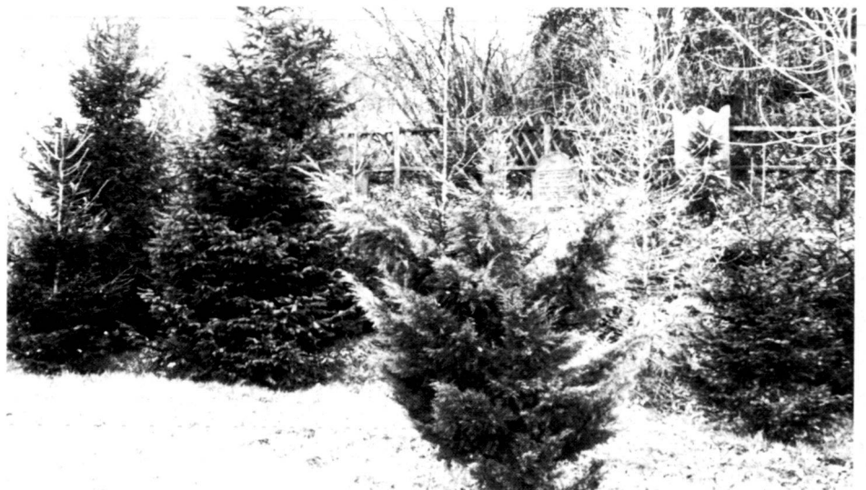
Hümme: Zerstörung eines Friedhofs durch gärtnerische «Aufforstung».