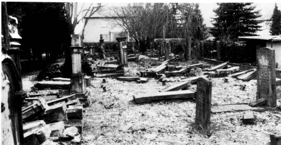
Eschwege: Trotz korrekter Vegetationspflege zeichnet sich hier der Zerfall des Friedhofes ab (Grabsteinumlegungen).

As early as 1957, the Federal Republic of Germany assumed responsibility for seeing to the upkeep of Jewish cemeteries. As burials and cemeteries are the concern of the local authorities and churches in West Germany, the local cemetery and horticultural authorities were instructed to carry out maintenance work on the cemeteries according to previously established guidelines. At present, the appropriate maintenance authorities receive an annual subsidy of DM 0.65 per square metre for looking after Jewish cemeteries. The laws on burials and cemeteries provide further administrative protection and state that the cemeteries of religious and ideological communities can only be used for other purposes with the consent of their sponsors, and this virtually signifies that Jewish cemeteries have a permanent right to exist. The registration of such cemeteries in the appropriate zone use and construction plans presupposes the